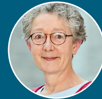
Renate Tix Geschäftsstelle